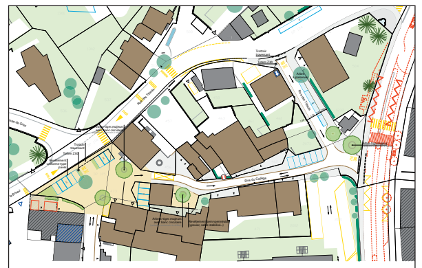
Schéma paysager d'ensemble (extrait - Profil paysage Sàrl)